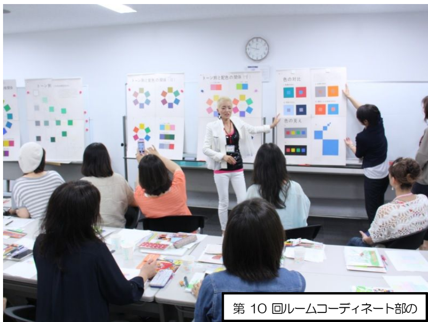
第10回ルームコーディネート部の様子

最近、似合う服がわからない、いまひとつコーディネートがきまらないとお悩みの方に、多数応募いただきました。その中から抽選で選ばれた、年齢も体形も違う10名の部員で約3カ月間学び、周囲の人にもアドバイスできるようになることを目指します。部員たちのビフォー、アフターのコーディネートにもご期待ください。