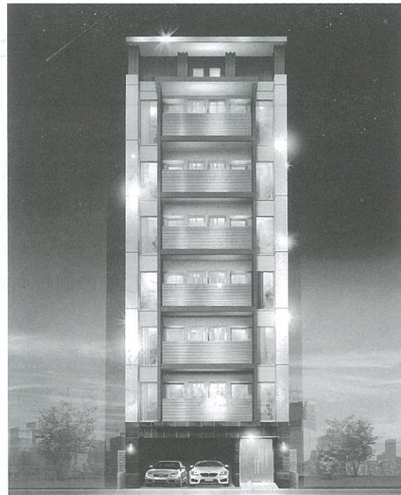
パラディーン赤坂

福岡市内では土地価格が異常に高騰している昨今でも、土地活用としてのマンション経営が盛んである。供給過多の感が否めない中、物件の差別化を図る上でペット共生マンションは一石を投じるのではないだろうか。